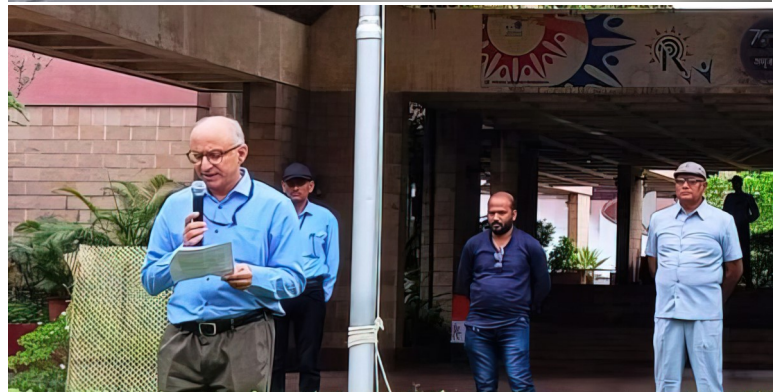
Images from the flag hoisting ceremony held at IPR main campus